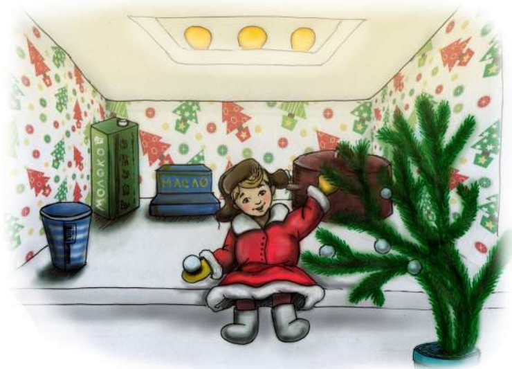
Иллюстрация Яны Алексеевской

— Да помню, тридцатое, — засмеялся Гошка.