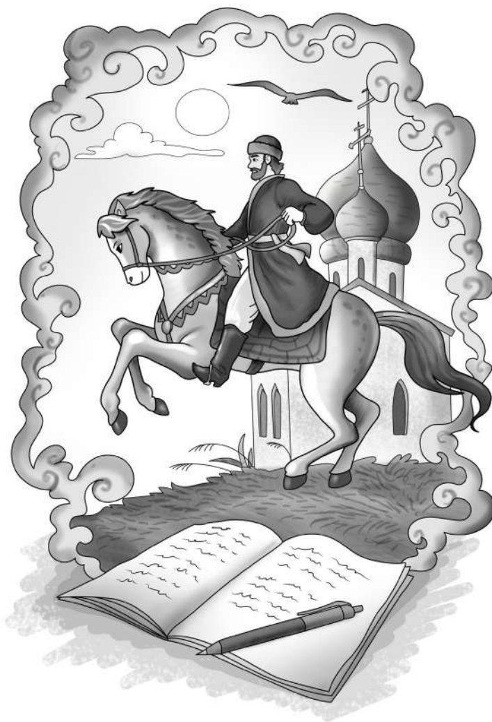
Иллюстрация Алисы Дьяченко

На берегу высоком Клязьмы В руках Андрея камень бел. Его возложит во фундамент. И мастеров со всех земель Сберёт сюда, затмить красою Желая Киев. Эта земля